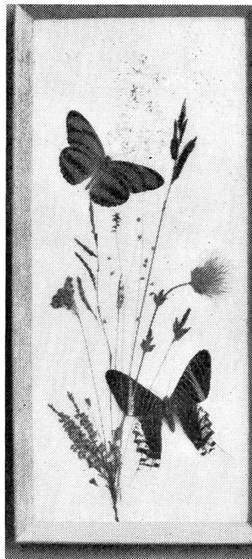
Eines der reizenden Blumenbilder.