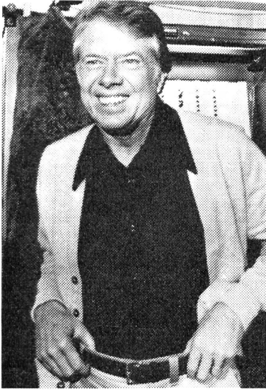
Unser Bild zeigt den neuen Präsidenten ein paar Tage vor seinem Amtsantritt. Zuversichtlich und unternehmungsfreudig schaut er in die Welt hinein.

gierung» keine Abstimmungen wie z. B. in unserem Bundesrat. Der Präsident allein bestimmt. Er kann einen Mitarbeiter in der Regierung entlassen, wenn er ihm nicht mehr passt. So hat Präsident Carter z. B. den weltbekanntesten Politiker Kissinger nicht in seinen Mitarbeiterstab aufgenommen und einen neuen «Aussenminister» ernannt.