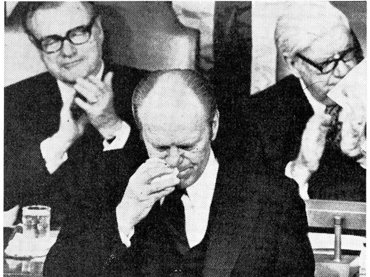
Eine Woche vor dem Ablauf seiner Amtszeit sprach Präsident Gerald Ford zum letztenmal vor dem Kongress der USA. Hinter ihm links der bisherige Vizepräsident Nelson Rockefeller, der sein Amt ebenfalls verloren hat. — Ford brach am Ende seiner Ansprache zusammen, der Abschied ging ihm sehr zu Herzen.