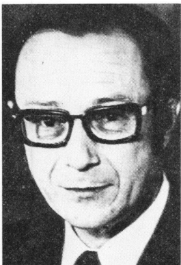
Bundespräsident für 1983: Pierre Aubert

Nach dem Wahltag hat man dann in gewissen Zeitungen ganz andere Töne angeschlagen. Auch wir gratulieren den beiden neuen Bundesräten Egli und Friedrich. Auch wir hoffen, dass sie gute Landesväter werden. Von allen Parteien sind sie als intelligente Schaffer anerkannt. Es sind Männer, die auf unserem demokratischen Schweizer Boden stehen. Wir hoffen auf eine gute Zusammenarbeit in unserer obersten Landesbehörde zum Wohle unseres lieben Vaterlandes, unserer Heimat. EC