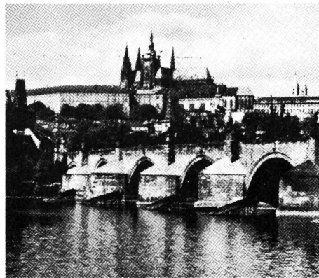
Prag mit dem Hradcany und der Karlsbrücke.

«Eine saubere Stadt», das war mein erster Eindruck. Die Stadt liegt an der Moldau, die im Böhmerwald entspringt, in die Elbe fliesst und