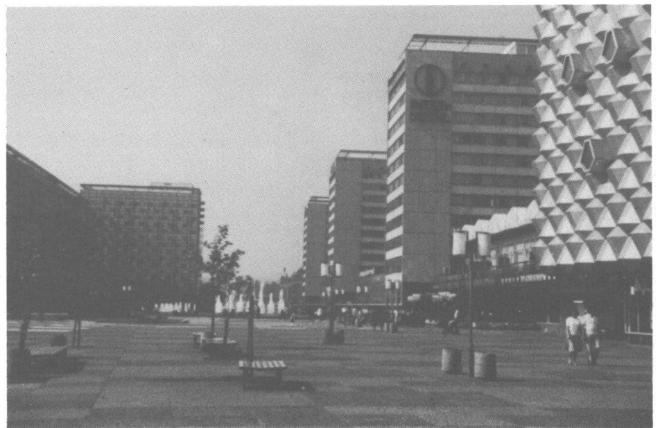
Das moderne Dresden.

Grossartigen Prunk zeigt das «Grüne Gewölbe» mit seinen Schmuck- und Dekorationsgegenständen. Man fragt sich: «Wo waren alle diese unersetzlichen Kostbarkeiten während der Bombardierung Dresdens 1945?» Ich nehme an, sie lagerten in Kellern abgelegener Schlösser. Solche Gebäude zu bombardieren, hatte strategisch doch keinen Sinn. Man fragt sich in diesem Zusammenhang auch nach dem Sinn der Zerstörung der weltberühmten Kunststadt. Er liegt einmal in dem, was Salis damals in seinem Wochenbericht am Radio sagte, war aber dazu doch noch ein psychologischer Schachzug der Politik.