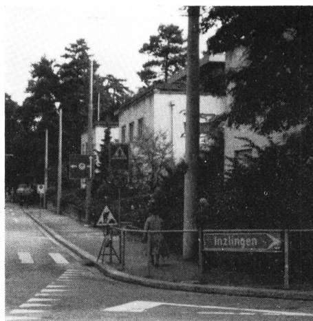
Die Schule hat ihren Namen der Zeit angepasst – das neue Gehörlosensymbol folgt bald...

(Bemerkung: Die Gehörlosenschule und die Sprachheilschule Riehen befinden sich im gleichen Areal.) Hae.