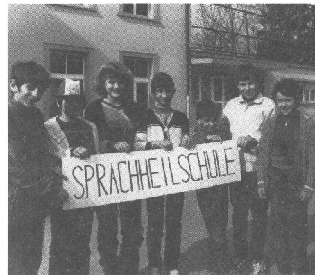
Namenwechsel in St. Gallen: Seit Frühjahr 1984 neu: «Sprachheilschule St. Gallen».

Die damalige «Taubstummenanstalt» hat in ihrer Geschichte wesentliche Veränderungen und manchen Umbruch erlebt. Im ersten Jahr nach der Eröffnung zählte