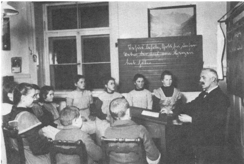
Oberklasse um 1900.