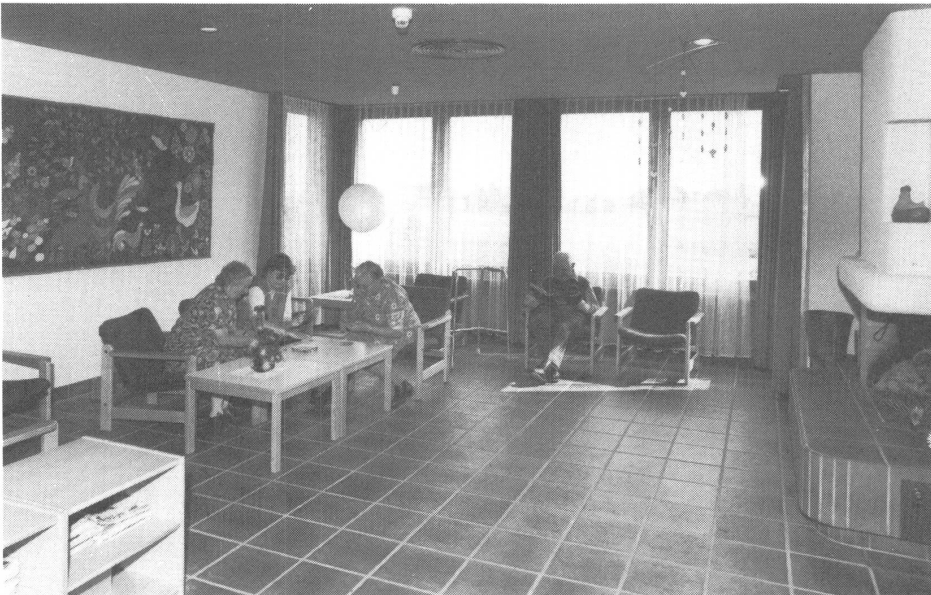
Der geräumige Aufenthaltsraum lädt ein zu gemeinsamem Tun.