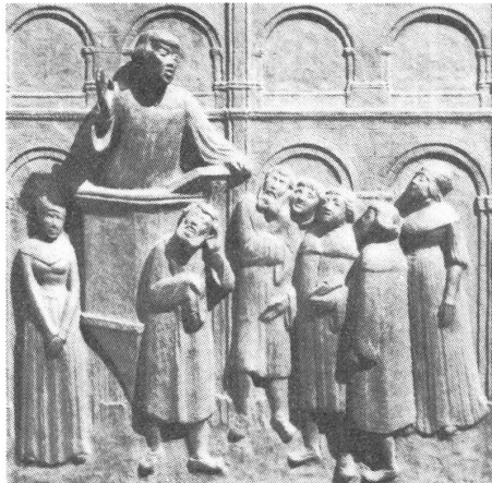
Zwingli predigt in Zürich. Relieftafel von Otto Münch, am Grossmünster – Südportal.

Staat und Kirche waren damals in Deutschland wie in der Eidgenossenschaft recht eng miteinander verbunden.