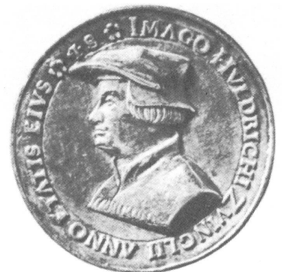
Bildnis Huldrych Zwinglis in seinem 48. Lebensjahr. Medaille von Jakob Stampfer, 1531

1531 Zweiter Kappelerkrieg; Zwingli stirbt am 11. Oktober auf dem Schlachtfeld. Mit der Wahl Bullingers als Nachfolger geht die Reformation weiter.