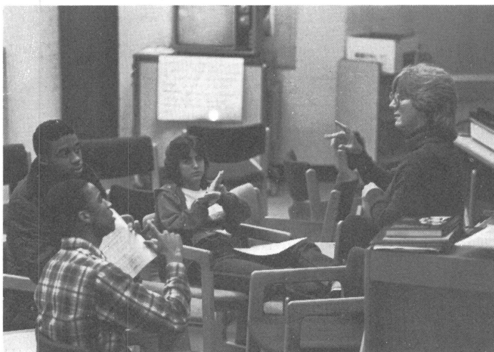
Unterricht in der Klasse.