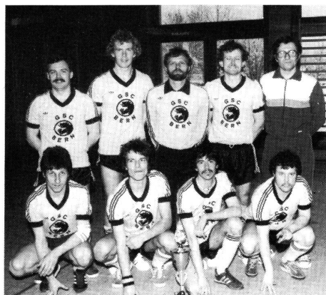
Turniersieger GSC Bern

Nun, es ist ja nicht aller Tage «Nacht». Man schweift in Gedanken schon zum Maskenball. Hier sind die Luzerner zuhause. Es versteht sich von selbst, dass bei der Rangverkündung kein Erstteamler des Gastgeber aufzuspüren ist. Entweder kann man den Verlockungen des Küchenchefs vom «Ochsen» nicht widerstehen, oder man lässt sich an der Bar im «Michaelshof» von der sympathischen «Ruthli» verwöhnen. In der Zwischenzeit ist der Turniersieger längst