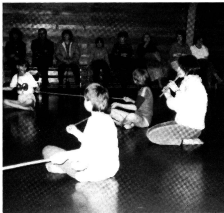
Rhythmikunterricht ist heute ein wichtiger Bestandteil für die Sprach- und Gemütsbildung und die Bewegungsfähigkeit des gehörlosen Kindes.

Die Zeit verging schnell. Noch wollte ich mich in einer Klasse mit gehörlosen Kindern umsehen und fand schliesslich das Klassenzimmer mit den Schülern der siebten Klasse. Sie werden von Frau B. Koller unterrichtet. Eben führten sie noch ihre Rechenaufgaben zu Ende. Zu meinem grossen Erstaunen malte anschliessend eines