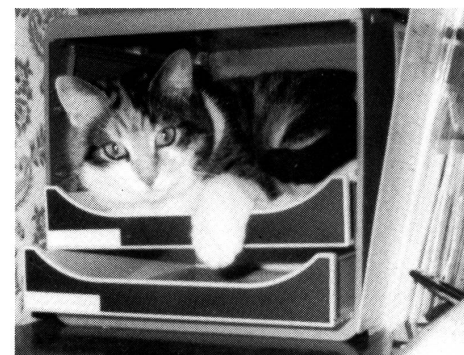
Der Redaktorin auf die Finger geschaut: In der Schublade lässt sich bequem liegen und die Arbeit der Redaktorin aus nächster Nähe beobachten! Hae.