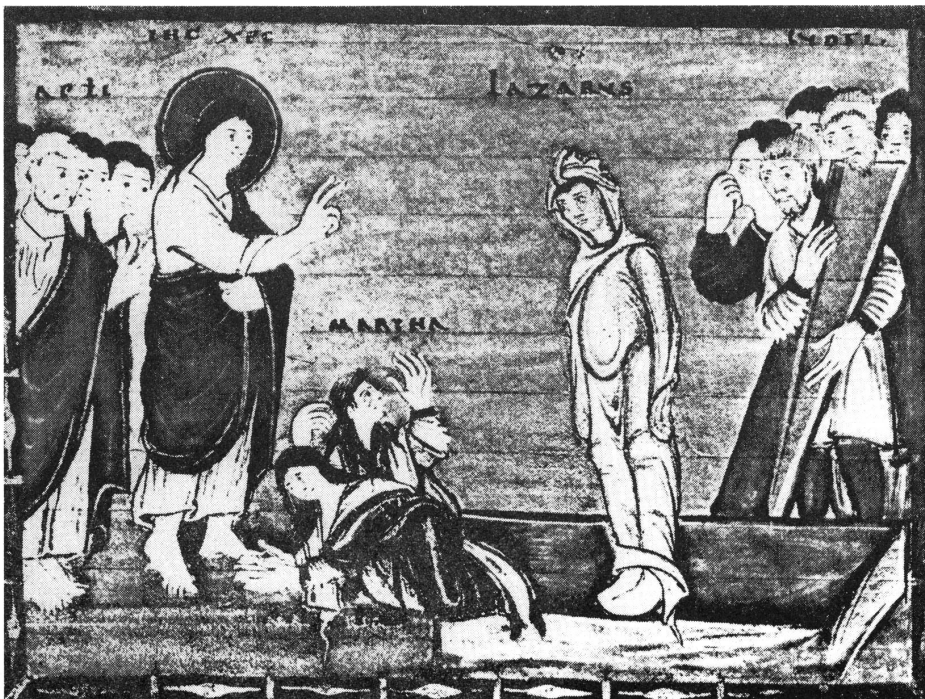
Der Mensch kann sich das Neue Leben nicht selber geben. Er muss – wie Lazarus – dazu erweckt werden.

Schild am Eingang eines Geschäftes in Marseille: «Heute ist ein zu schöner Tag, um Geschäfte zu machen. Folgen Sie meinem Beispiel: Gehen Sie ans Meer, geniessen Sie den Tag, und essen Sie am Abend etwas besonders Gutes. Morgen bin ich dann wieder für Sie da. Auf Wiedersehen!»