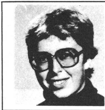
Ein Bericht unserer GZ-Redaktorin Trudi Bühlmann

In Nr. 5 der GZ erschien der Hinweis auf diese Tagung. Die Veranstalter hatten schon einen grossen Erfolg, bevor die Tagung begann: Weil sich so viele Interessenten meldeten, musste die Tagung in einen Hörsaal der Universität verlegt werden. Die Organisation war ausgezeichnet; von den Wegweisern über die Ringleitung bis hin zum Hellraumprojektor, an dem alles zu lesen war, hatte man an alles gedacht – und es funktionierte von Anfang an tiptopp!