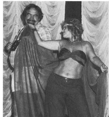
So leicht lässt man sich im Orient verführen!

Zwölf Mannschaften haben die Organisatoren eingeladen. Aus dem Ausland erschienen Karlsruhe, Bodensee, Ulm (alle BRD), Groningen (NL) und Bergamo (I). Sie alle erwiesen sich im nachhinein als krasse Versager. Die Tifosis aus Bergamo gefielen vor allem durch ihr Mundwerk, spielten aber fair. Bodensee war schwach, Ulm sogar superschwach, Groningen kam mit bloss acht (!) Mann. Einzig Karlsruhe vermochte einigermaßen mitzuhalten. 1. St. Gallen, 2. Luzern, 3. Bern, 4. Karlsruhe, 5. Aarau (die grosse positive Überraschung), so die Schlussrangliste. wag