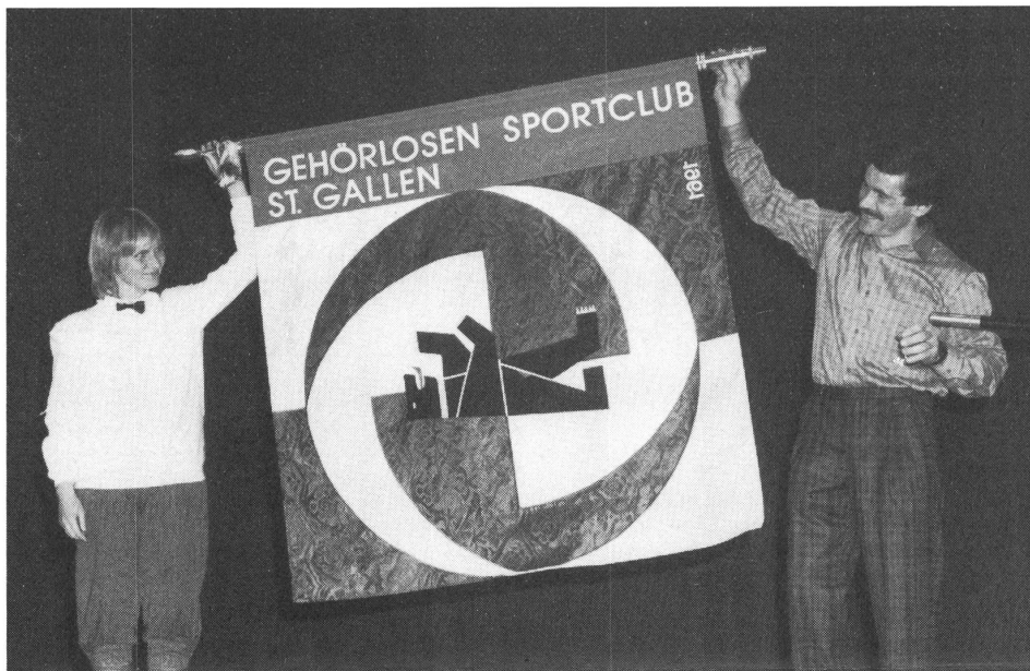
Jetzt hat auch der GSC St. Gallen seine Fahne.

Das war grandios, alles, was es zu gewinnen gab, hat er gewonnen; der Gehörlosen-Sportclub St. Gallen: den Pokalgewinn am internationalen Fussballturnier, einen zweifachen Triumph am Kegeltturnier und einen unerwarteten Sieg am Schachturnier. Als Knüller der 25-Jahr-Feier des Sportclubs stieg der abendliche Jubiläumsakt mit der schlichten Fahnweihe im prallgefüllten «Schützengarten».