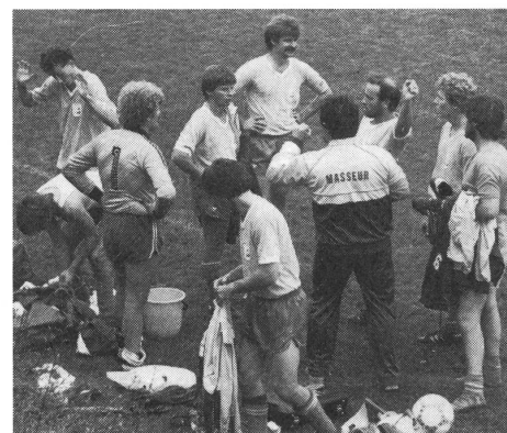
Luzern nach dem Final: «Warum haben wir verloren?»

Zwölf Mannschaften haben die Organisatoren eingeladen. Aus dem Ausland erschienen Karlsruhe, Bodensee, Ulm (alle BRD), Groningen (NL) und Bergamo (I). Sie alle erwiesen sich im nachhinein als krasse Versager. Die Tifosis aus Bergamo gefielen vor allem durch ihr Mundwerk, spielten aber fair. Bodensee war schwach, Ulm sogar superschwach, Groningen kam mit bloss acht (!) Mann. Einzig Karlsruhe vermochte einigermaßen mitzuhalten. 1. St. Gallen, 2. Luzern, 3. Bern, 4. Karlsruhe, 5. Aarau (die grosse positive Überraschung), so die Schlussrangliste. wag