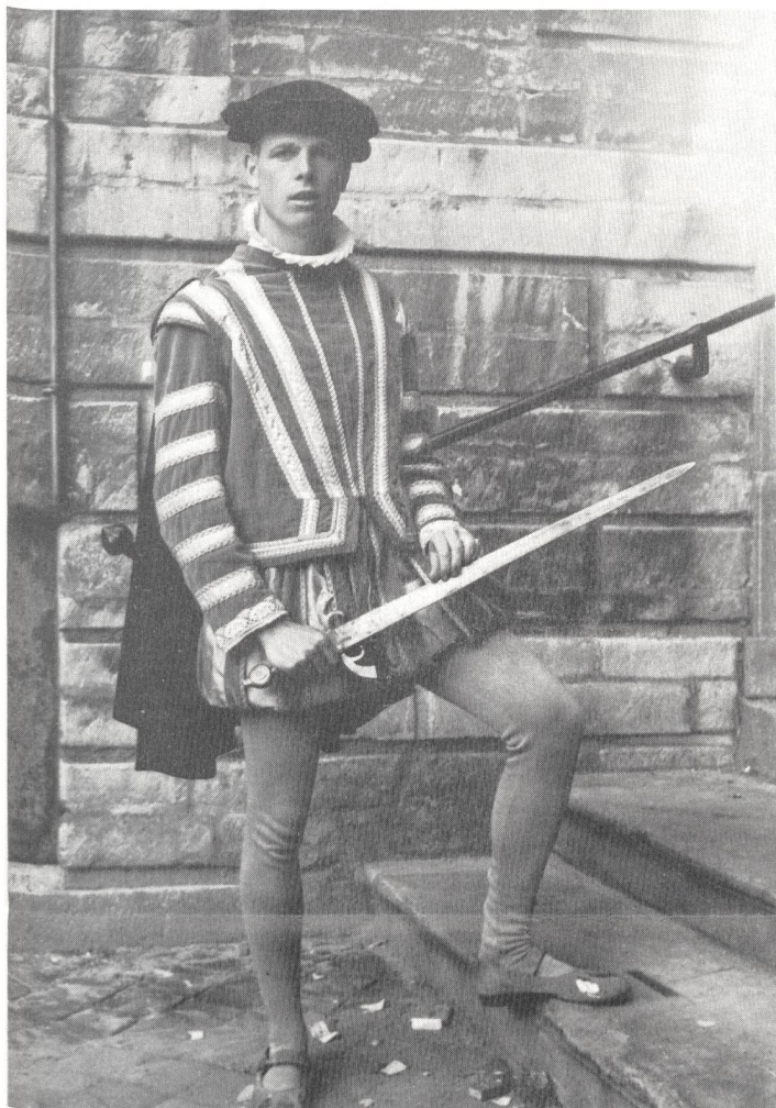
In Brügge, 1960. Auf einer Reise mit der Kunstgewerbeschule wurden die Schüler für einen Film angeworben.