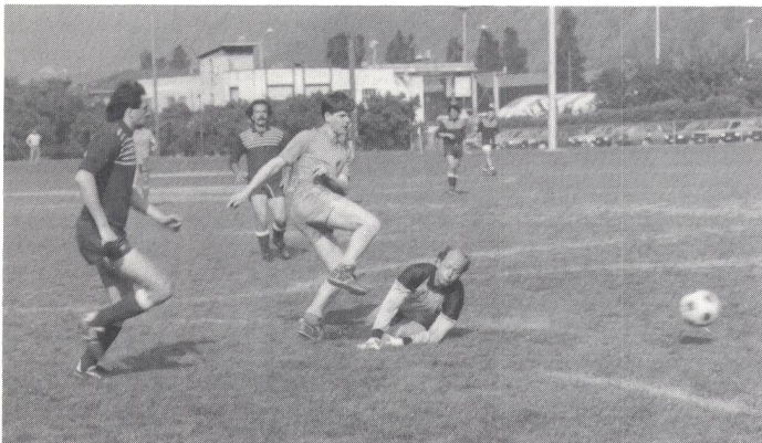
Im Final: In diesem Moment fällt das 1:1 in der letzten Spielminute.

(wag) Das in Martigny von elf Mannschaften bestrittene internationale Fussballturnier entschied Brüssel nach einem turbulenten Finish glücklich für sich. Höhepunkt der Festivitäten war natürlich der Galaabend mit der eindrücklichen Zaubershow des Weltmeisters Pierre Brahma aus Paris. Dass am gleichen Abend an der Bar gut zwei Dutzend Gläser in Brüche gingen, hatte mit Böswilligkeit und Alkoholkonsum kaum etwas zu tun. Es herrschte ein Massenandrang, denn gut 1000 Besucher begehrten Einlass.