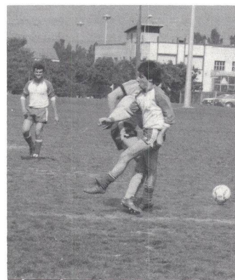
Bern – Luzern: Der Ball ist weg, aber wer foult wen?