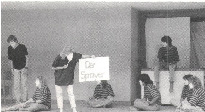
Szene vier wird angesagt: Der Sprayer in der Schule . . .