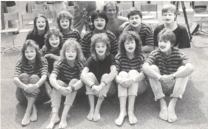
Zeigte eine absolut bühnenreife Show, die Pantomimegruppe der Sekundarschule für Gehörlose.

Solche Zustände herrschen an der Sekundarschule für Gehörlose in Zürich zum Glück nicht – auch wenn die gehörlosen Kinder heute nicht mehr die braven Schäfchen von einst sind. Da hat eine Emanzipation stattgefunden; die gehörlosen Schüler aller Stufen sind nicht weniger «frech» (oder sagen wir: selbstbewusst) als die Hörenden.