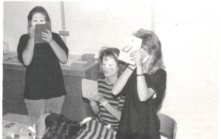
Das Spiel ist zu Ende: Jetzt folgt das Abschminken; eine kleine «Tortur».

Schweizerische Vereinigung der Eltern hörgeschädigter Kinder, SVEHK