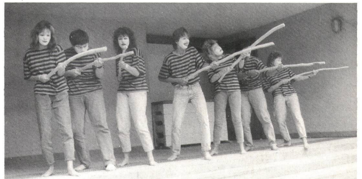
Gehörlose Sek.-Schüler: Brutalität lediglich auf der Bühne.