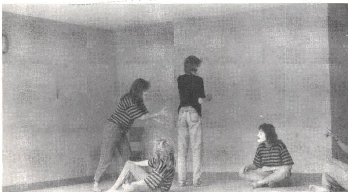
. . . und schon ist sie da, währenddem der Lehrer nichts merkt und an der Wandtafel schreibt.