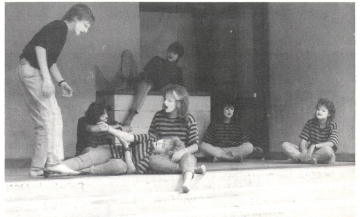
Erschütternde Szene: Sie spritzt sich in der Schule Drogen vor den Augen des Lehrers.