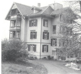
Sitz der GHE in Wald.

A.J.: Richtig. Auch wenn Störungen an Lichtsignalanlagen (Telefunk, Teleblink) gemeldet werden, bin ich dafür einsatzbereit. Ich stehe auch zur Verfügung für Anpass-