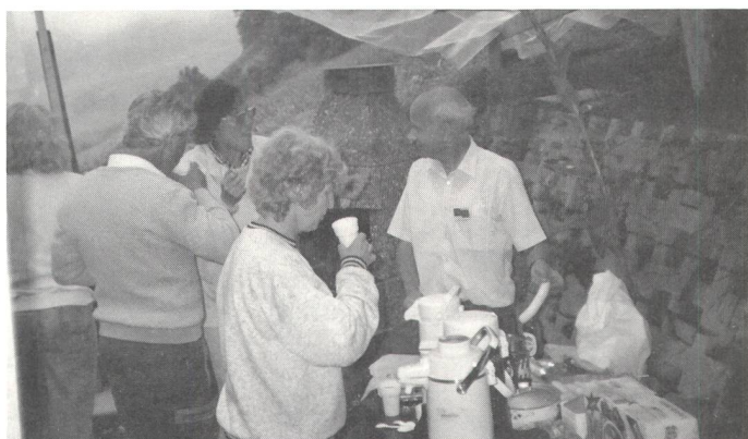
Auch das miese Wetter hielt nicht vom Besuch der Festwirtschaft ab.

Die Zeit drängte, die Gäste wurden in Privatautos auf Tristel geführt. Dazu gesellten sich noch mehrere andere Gehörlose, die im Hotel Hausstock beim Mittagessen zusammensassen. Trotz der ungünstigen Witterung liessen sie es sich nicht nehmen, das Berghaus «Tristel» zu besuchen. Bei grillierten Würsten, Kaffee und Kuchen sass man fröhlich zusammen. Es wurde eifrig diskutiert, Lob