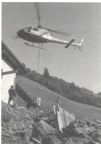
Helikoptereinsatz während der Umbauarbeiten!

Sonntag, 3. September 1989: Leider zeigte sich das Sonntagswetter nicht von seiner besten Seite. Aber die Organisatoren wussten sich zu helfen, damit das Fest nicht unter der schlechten Witterung litt. So hatten mehrere Vereinsmitglieder, gewarnt durch die schlechte Wettervorhersage des Fernsehens, bereits am Vortag tüchtig Hand anlegen müssen. Auf dem südlichen Sitzplatz, wo auch das Cheminée steht, wurde mit Plastikabdeckung ein Vorbau erstellt, so dass das vorgesehene Grillfest am Sonntag trotzdem durchgeführt werden konnte. Begonnen hatte der Festtag nicht auf dem «Tristel», sondern im Dorf Elm. Hier im alten