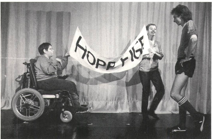
Szene aus dem Theaterstück: Eva (behindert) und ein Nichtbehinderter spornen Fige beim «Tschutten» an.

auch mit menschlichen Barrieren zu kämpfen. Damit eine Integration möglich wird, muss man sich begegnen, sich kennen und verstehen lernen. Zur Förderung dieser Integration legten die Initianten dem Projekt die Idee zugrunde, die Rollen der behinderten Personen im Stück von Betroffenen selbst spielen zu lassen. Dabei sollte es sich aber nicht um ein herkömmliches «Behinderten-Theater» handeln. Vielmehr wurde eine in der Schweiz noch wenig bekannte Form des «Sensibilisierungstheater» verwirklicht: Ein professionelles Ensemble erarbeitete mit betroffenen Laiendarstellern ein Stück, in das die Beteiligten ihre persönlichen Erfahrungen zum Thema einbringen konnten.