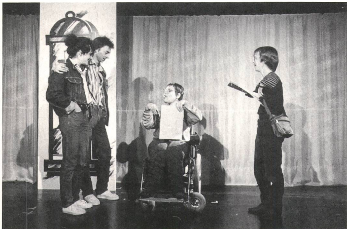
«Füür und Flamme»: Behinderte und Nichtbehinderte gemeinsam auf der Bühne im gleichen Theaterstück.

(GZ) Zwei Jahre lang war das Theaterstück «Füür und Flamme» (= Feuer und Flamme) auf Tournee durch die Deutschschweiz. Das Stück entstand im Auftrag der Pro Infirmis und des Schweizerischen Roten Kreuzes. Inszeniert wurde es vom Berner «Zimmertheater Chindlifrässer». Auch Schüler der Gehörlosenschulen Zürich, St.Gallen, Hohenrain, der Sekundarschule und der Berufsschule für Gehörlose, haben der Theateraufführung beiwohnen können. Die GZ berichtete im Juni 1988 darüber.