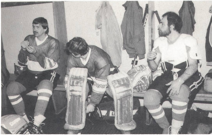
Taktische Anweisungen während dem Umziehen.

Sport. Für die Eismiete werden oft überrissene Preise verlangt, meistens verrechnet man dazu noch Gebühren für die maschinelle Eisreinigung. Wegen Überlastung der Eisbahn (auch das Publikum will eislaufen) können die Innsbrucker Gehörlosen jeweils nur am Samstagvormittag auf das Eis. Der Tarif pro Stunde beträgt knapp 1300 Schilling (= 160 Franken), doch die Eisbahndirektion zeigt sich grosszügig und lässt diesen Tarif für 90 Minuten gelten. Die Ausrüstung ist eigen, Spenden und Sammlungen machten die Anschaf-