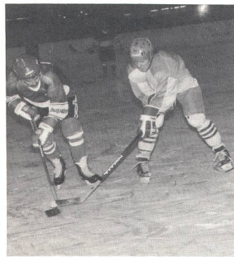
EC Tirol (rechts) ist in Scheibenbesitz.

Sport. Für die Eismiete werden oft überrissene Preise verlangt, meistens verrechnet man dazu noch Gebühren für die maschinelle Eisreinigung. Wegen Überlastung der Eisbahn (auch das Publikum will eislaufen) können die Innsbrucker Gehörlosen jeweils nur am Samstagvormittag auf das Eis. Der Tarif pro Stunde beträgt knapp 1300 Schilling (= 160 Franken), doch die Eisbahndirektion zeigt sich grosszügig und lässt diesen Tarif für 90 Minuten gelten. Die Ausrüstung ist eigen, Spenden und Sammlungen machten die Anschaf-