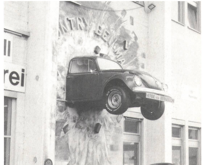
Auch der VW Käfer gehört der Vergangenheit an.

(wag) Als 1890 in der Schweiz die ersten Autos aufkamen, hat man sie bestaunt, und als sie dann immer schneller und besser wurden, begann man sie zu hassen. Wo ein Auto durch die Landschaft fuhr, liess es eine stickige Staubwolke hinter sich, denn es gab damals noch keine Asphaltstrassen. Und die Autos damals waren auch sehr lärmig. Um die Fussgänger vor diesen Belästigungen zu schützen, hat man sogar Sonntagsfahrverbote eingeführt.