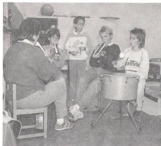
Musikunterricht auch für Hörgeschädigte.