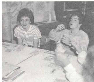
Szene aus dem Geschichtsunterricht.