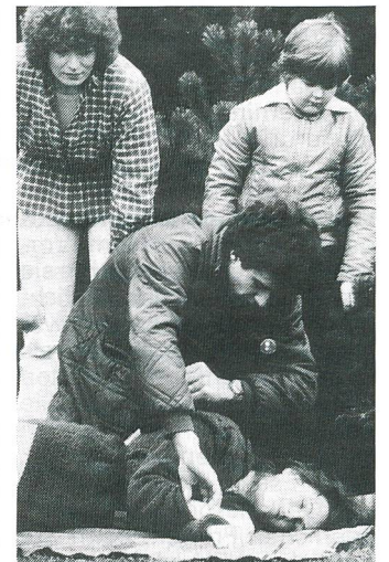
Grundkenntnisse in Erster Hilfe sind von Nutzen!

Zecken können zwei Krankheiten übertragen: Viren verursachen die Zeckenencephalitis FSME (eine Hirnhautent-