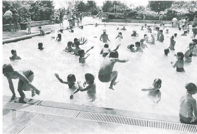
Auch beim vergnüglichen Bad heisst es vorsichtig sein.

Schmerzen in den Ohren während des Steig- und Sinkflugs quälen Erwachsene mit engen Gehörgängen und fast alle Kleinkinder. Das hilft bei Beschwerden: trinken, Kaugummi kauen, abschwellende Nasentropfen vor dem Flug