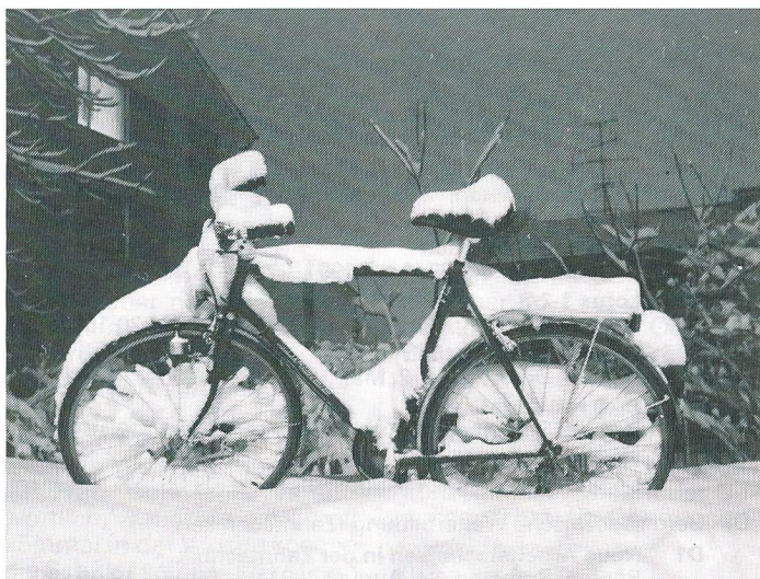
Der Schnee ist geschmolzen...

Velofahren ist so beliebt wie noch nie. 2,5 Millionen Fahrräder gibt es in der Schweiz, und die meisten werden benutzt: zum Einkaufen, zum Ausfahren oder zum Bluffen. Denn das Velo ist mehr als ein umweltfreundliches Verkehrsmittel, es ist auch – immer mehr – ein Modeartikel, der in Farbe und Form dem jeweiligen Trend entspricht.