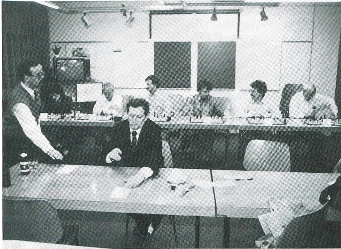
Die Spielsituation – fotografiert und gezeichnet