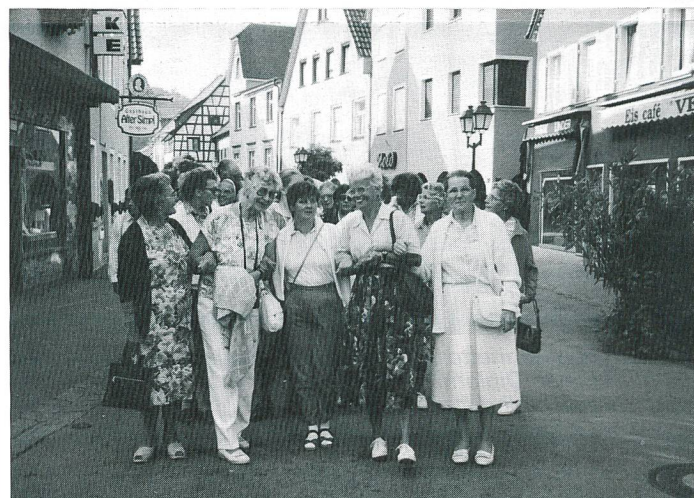
Beim Bummel durch die malerische Altstadt.

Die Stimmen sagten, es war wunderschön. Auch ich habe es so erlebt. Für mich war es ein besonderes Erlebnis, ein schöner Abschluss. Dieser wird mich in die Zukunft begleiten. Wer zu diesen schönen Stunden beitrug, dem sage ich ein herzliches «Vergelt's Gott!» ha