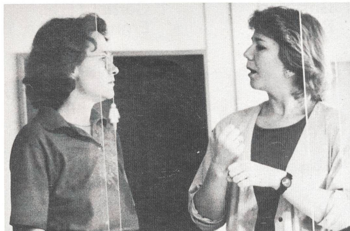
Gehörlosendolmetscherin im Einsatz.