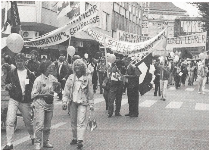
Sympathieumzug in St. Gallen am Tag der Gehörlosen.