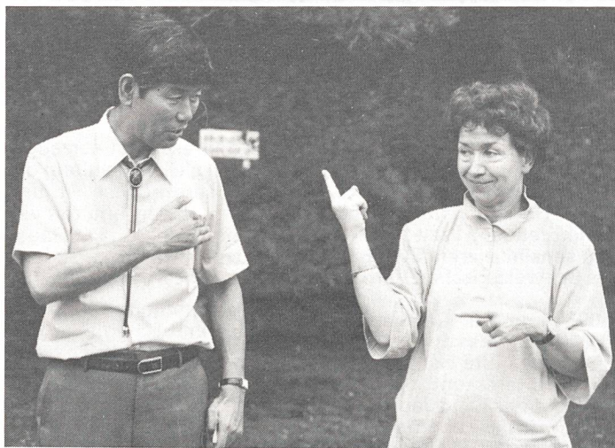
Unsere Dolmetscherin unterhält sich mit dem japanischen Reiseführer.