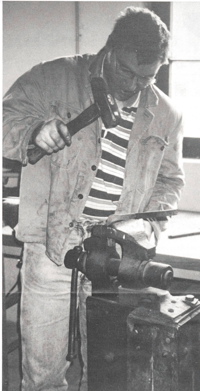
Seit Mitte Jahr hat das Schloss eine Schmiede.

Wieder schlossen zwei Jugendliche ihre Anlehre in der