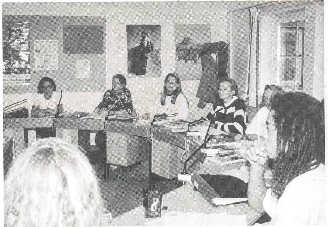
Oberstufenklasse in der Berufsschule Oebero.

Und der Ombudsmann der Eltern (hörender Vater einer gehörlosen Tochter) meinte: «Heute haben die Gehörlosen