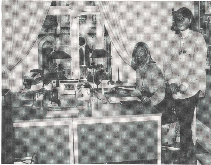
Zwei schwedische Dolmetscherinnen in ihrem Büro auf der Vermittlungsstelle in Örebro.