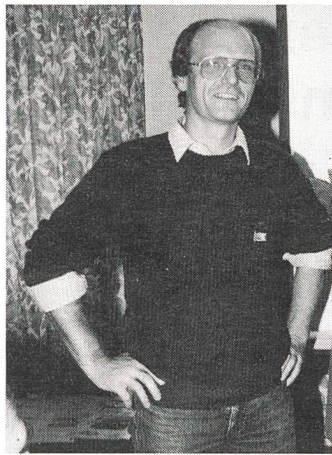
Der neue Präsident: Alexander Grauwiler.

Januar 1992 brachte die Einführung des Benutzerabonnements. Die angespannte Finanzlage zwang dazu. Die Informationsbroschüre «Meinungen, Behauptungen, Fragen... und Antworten» orientiert darüber. Im Verlaufe dieses Jahres wird sich zeigen, ob eine Zusammenarbeit PROCOM/Bell-Stiftung möglich ist. Möglich ist seit wenigen Tagen ein Vermittlungsdienst in italienischer Sprache