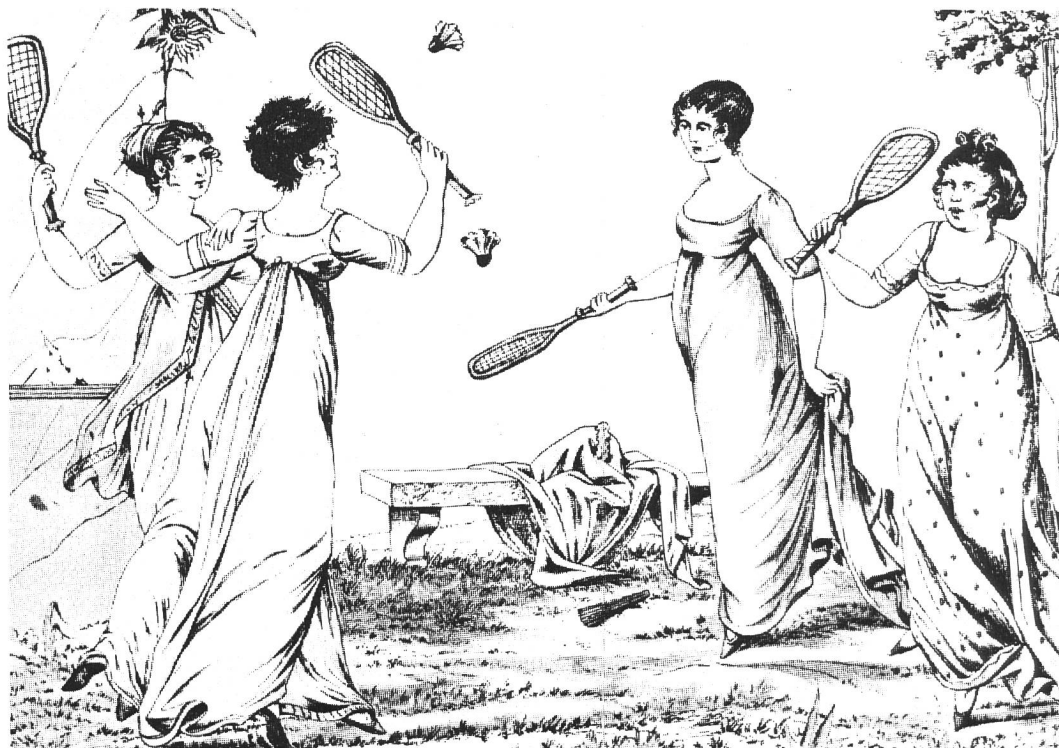
Mädchen, die zum Zeitvertreib Federball spielen (etwa um 1800)

Bisher wurden nur Weltmeisterschaften in den verschiedenen Ländern ausgetragen, bis im Jahre 1988 die Sportart Badminton als Demonstrationswettbewerb in Seoul/Korea eingeführt wurde. Letztes Jahr wurde Badmin-