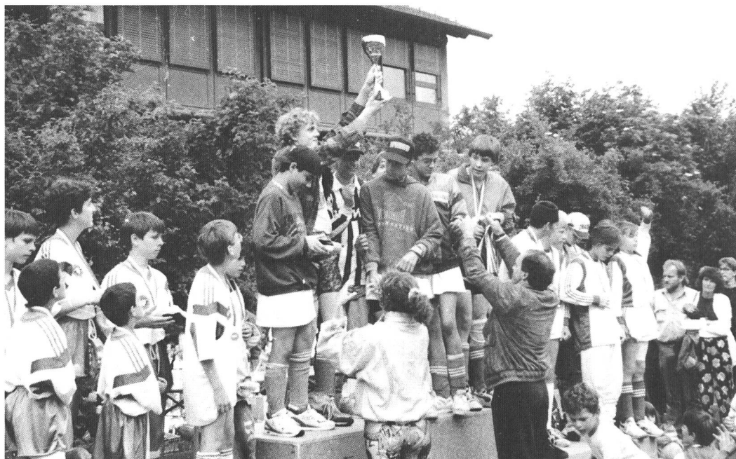
Das herrliche Gefühl bei der Siegerehrung.

war erfreulich zu sehen, dass sich neben den Fussballspielern/-innen auch Eltern, Geschwister, Freunde und Bekannte daran beteiligten. Das Risiko des OK's sollte sich lohnen. Trotz schlechter Wettervorhersage blieb es den ganzen Tag trocken. Das 6. Hohneri-Fussballturnier wird so allen in bester Erinnerung bleiben.