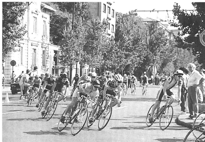
Die Schweizer Sprinter beim 50-km-Strassen-Radpunktfahren.

Abbou/Teboul (FRA) – Läubli/Bivetti (SUI) 6:2, 6:0; Deladoëy/Niggli (SUI) – Papadopolu/Sburlea (ROM) 6:3, 2:6, 2:6.