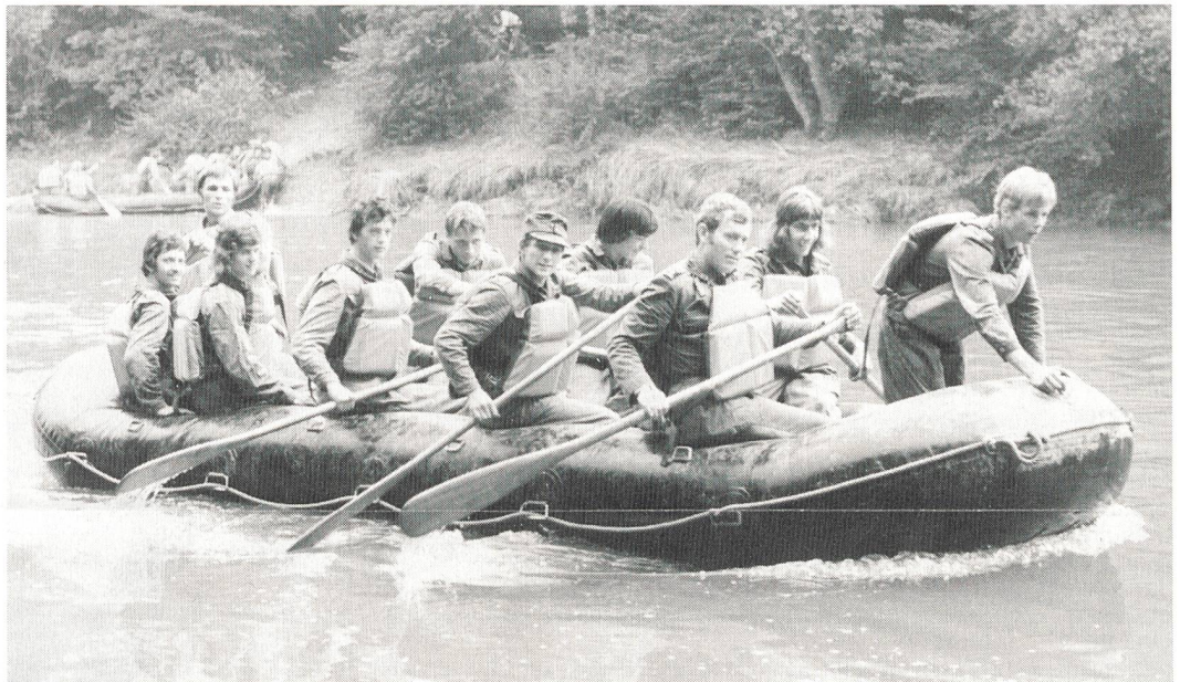
Es war ein langer Weg: Gehörlose und alle, die eine IV-Rente oder Hilflosenentschädigung erhalten, sind vom Militärpflichtersatz befreit.

Dank einem Antrag von Nationalrat Marc Suter (er ist selbst querschnittgelähmt) müssen auch weitere Personen keinen Militärpflichtersatz mehr bezahlen. Unter diese Bestimmung fallen zum Beispiel Gehörlose oder Kleinwüchsige, die dienstuntauglich sind und keine IV-Rente oder Hilflosenentschädigung erhalten.