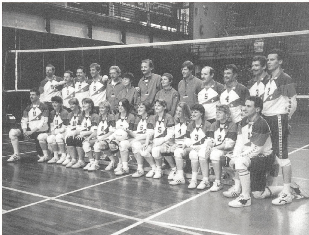
Die Schweizer Delegation in Bolzano.

Das Kader der Damen wies vier routinierte Spielerinnen auf. Die übrigen acht Spielerinnen sind Neulinge und zum Teil auch unerfahren. Deswegen konnten wir in die Damen keine grossen Erwartungen setzen. Das 1. Spiel gegen Österreich konnten wir zu unseren Gunsten entscheiden mit einem klaren 3:0-Sieg. Im zweite Spiel gegen Italien versagten wir im 1. und 2. Satz durch viele individuelle Fehler kläglich. Mit einer grossen Leistungssteigerung konnten unsere Damen endlich im 3. Satz überzeugen. Doch verloren sie knapp mit 13:15 Bällen. In der Hoffnung, dass sie in den nächsten Spielen an diesen Leistungen anknüpfen würden, gab es eine Kehrseite: Im 3. Spiel gegen Polen verpassten sie den Einzugs in die