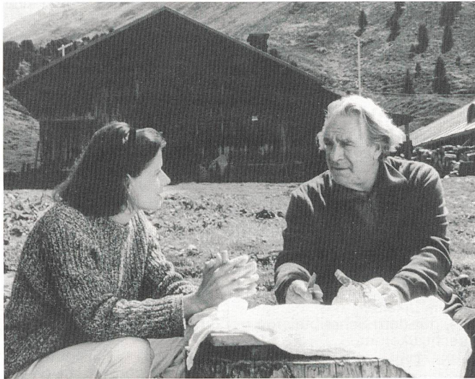
«Die Direktorin», ab dem 27. November untertitelt im Schweizer Fernsehen

«Die Direktorin» ist eine Gemeinschaftsproduktion mit dem Zweiten Deutschen Fernsehen ZDF und spielt im erfundenen Bündner Bergdorf Madruns. Als dort eine neue Direktorin des Verkehrsvereins ihr Amt aufnimmt, gerät sie in die Intrigen und Streitereien der Dorfgemeinschaft. Das kann ja spannend werden! Start der Serie ist am Sonntag, 27. November, 20.00 Uhr, mit dem Pilotfilm und anschliessend 24 weitere