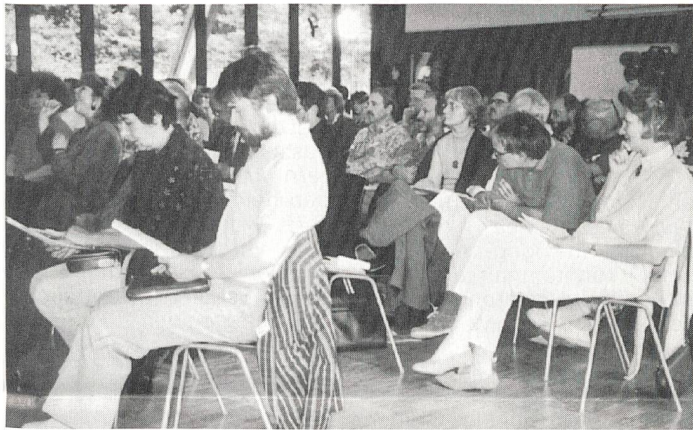
Die Delegierten studieren den Entwurf der neuen Statuten, die nicht in Kraft gesetzt wurden.

Vertreterinnen und Vertreter von SVG, SGB, der Elternvereinigung dankten dem zurücktretenden Präsidenten für sein grosses Engagement, seine Weitsicht und für seine vermittelnde Art. «Hart in der