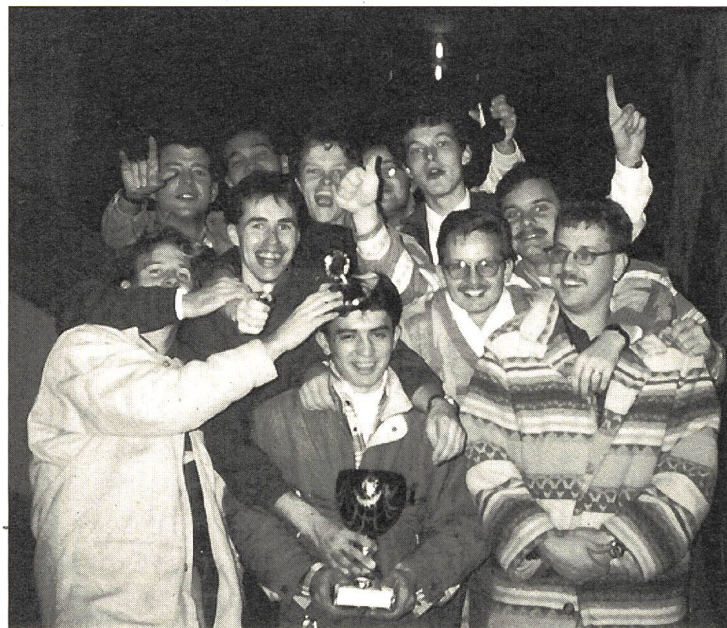
GSV Zürich: Die neuen Schweizermeister des 1. Hallen- und Freiluft-Fussballturniers vom 26. November 1994 in Stäfa.

Herzliche Gratulation! Für den GSV Zürich spielten am 26. November 1994 an der