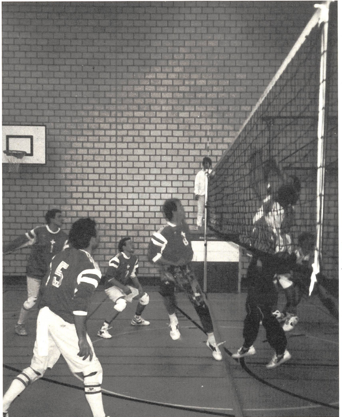
Szene beim Volleyballmatch am Netz.