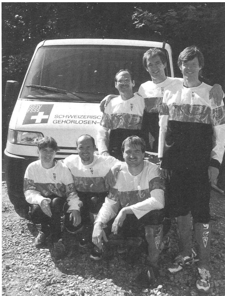
Der SGSV erhielt einen neuen Sponsorenbus. Hier im Bild mit den Schweizer Orientierungsläufern.

Die Schlusszeremonie wurde draussen vor dem Oberstufenzentrum Grünau in Wittenbach abgehalten. Zuerst wurden die Medaillen vergeben. Während der Schlusszeremonie erklärte das EDSO-Mitglied Béla Pányi, Ungarn, die 3. OL-EM der Gehörlosen für beendet. Die EDSO-Fahne wurde eingezogen und anschliessend den Offiziellen der ungarischen Mannschaft übergeben. Die nächste 4. OL-EM findet in Ungarn statt. Hans Risberg, Schweden, trat als