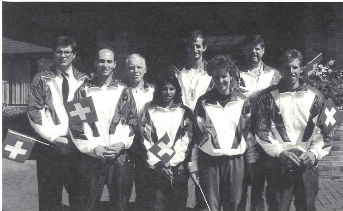
Die Schweizermannschaft in England