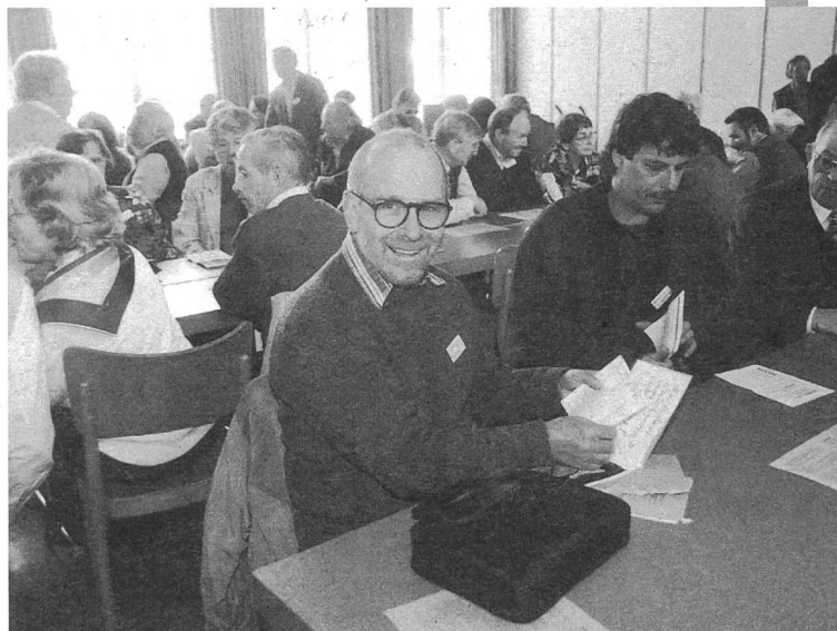
Zufriedene Gesichter in der grossen Schar der Teilnehmerinnen und Teilnehmer.

pro audito Hörbehinderten-Vereine Kanton Bern Sternengässchen 1 3011 Bern Tel. und TS 031 311 57 81 Fax 031 311 00 62 Beratungsstelle für Gehörlose Mühlemattstrasse 47 3000 Bern Tel. 031 371 26 54 TS 031 371 26 55 Fax 031 371 09 69