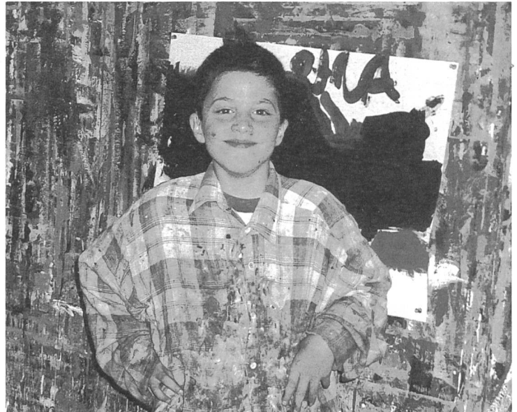
Bei der Maltherapie kann man seinen Ideen freien Lauf lassen.

Bei meinem zweiten Besuch befinden sich die Kinder im Therapieraum. Genüsslich be-