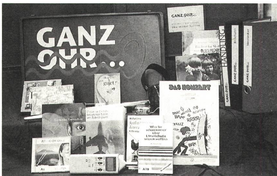
Die Medienkiste regt zur Auseinandersetzung mit dem Themenkreis Gehör und Lärm an