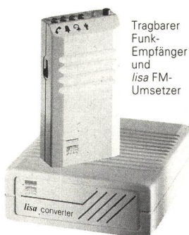
Tragbarer Funk- Empfänger und lisa FM- Umsetzer