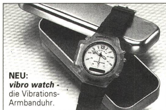
NEU: vibro watch - die Vibrations- Armbanduhr.