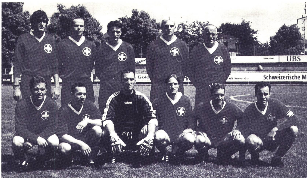
Unsere Schweizer Nati (auf dem Foto fehlen die Ersatzspieler) kurz vor dem Anpfiff