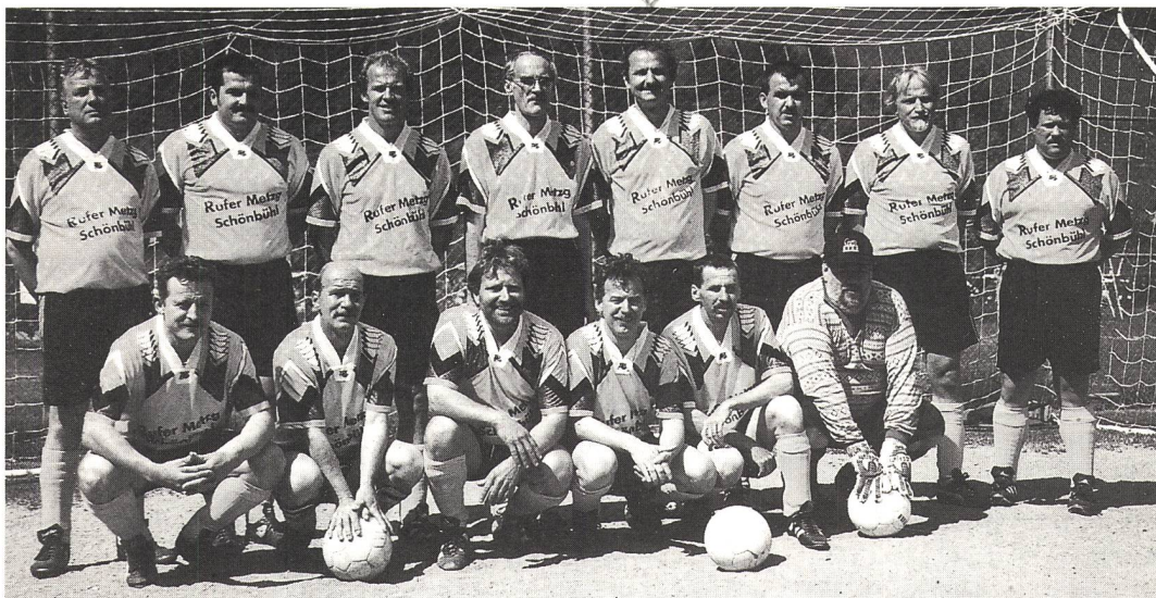
Vor dem Start: Gruppenbild der Senioren-Tschütteler vom GSCB

yh/Nachdem ich vernahm, dass die Berner Senioren-Fussballer vom GSCB am Samstag, 23. Mai 1998 wahrscheinlich ihren letzten Einsatz spielen würden, wollte ich es unbedingt genauer wissen. Ich ging hin nach Rüschegg/Graben (Nähe Schwarzenburg und Köniz). 14 Spieler waren anwesend. Eine Gruppe Zuschauerinnen und Zuschauer, meist ihre eigenen Familien und Freunde, umsäumten das Spielfeld.