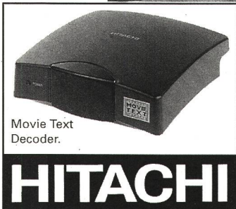
Movie Text Decoder.

(Dienstleistungs- marke des ECI (European Captioning Institute Ltd.)