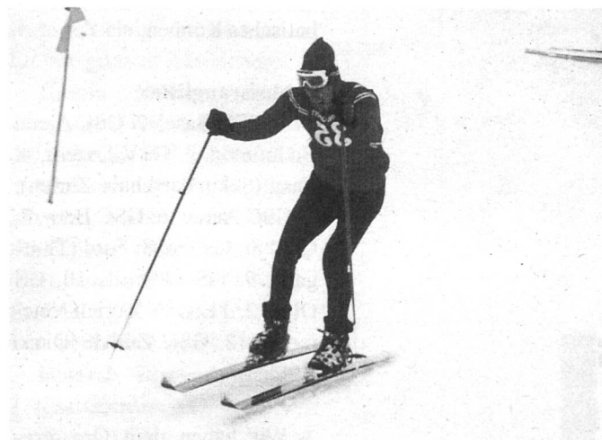
1971 in Adelboden: auf der Zielgeraden zum Slalom-Weltmeister

Heute bin ich 54 Jahre alt und immer noch kein bisschen müde vom Skifahren. Auch meine Familie fährt regelmäs-