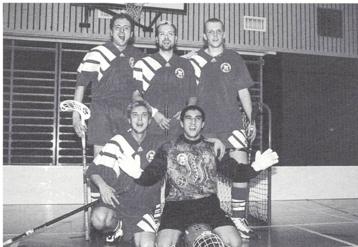
Die strahlenden Sieger vom GSV Basel