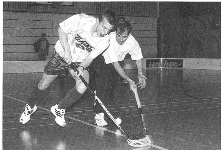
In voller Aktion ... gelingt der Schuss ins Tor?

RP: Ich bin erstaunt, dass die Gehörlosen das Reglement schon so gut kennen. Es gab noch kleine Differenzen, die aber schnell aufgeklärt wurden. Die Schiedsrichter bemühten sich sehr, die Regeln zu erklären.