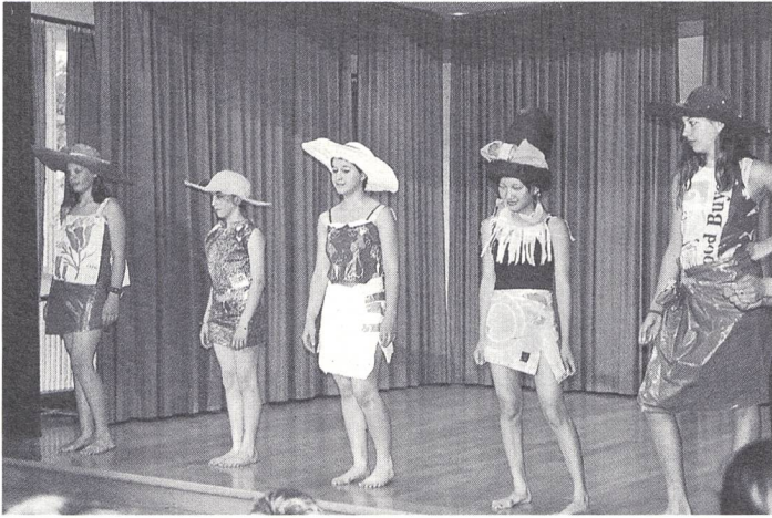
Die Modeschau mit den neuen Sommerhits: «It's a plastic time!»

Trotzdem finde ich es gut, dass wir mit ihnen zusammenarbeiten. Sicher wollen sie auch wissen, wie es bei hörenden Kindern in der Schule ist. Auch Gehörlose brauchen Freunde ...»