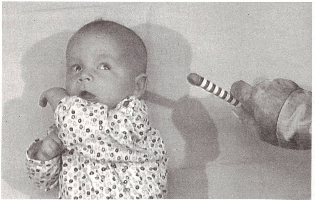
... wenn das Kind entwicklungs-mässig noch nicht so weit oder jünger ist, reagiert es mit Horchen. Hier als Beispiel: Die Augen drehen nach der Geräuschquelle.

der Schweizerischen Vereinigung der Eltern hörgeschädigter Kinder SVEHK, ein Vertreter der Betroffenen, ein Audiologe, HNO-Spezialarzt, ein Kinderarzt.